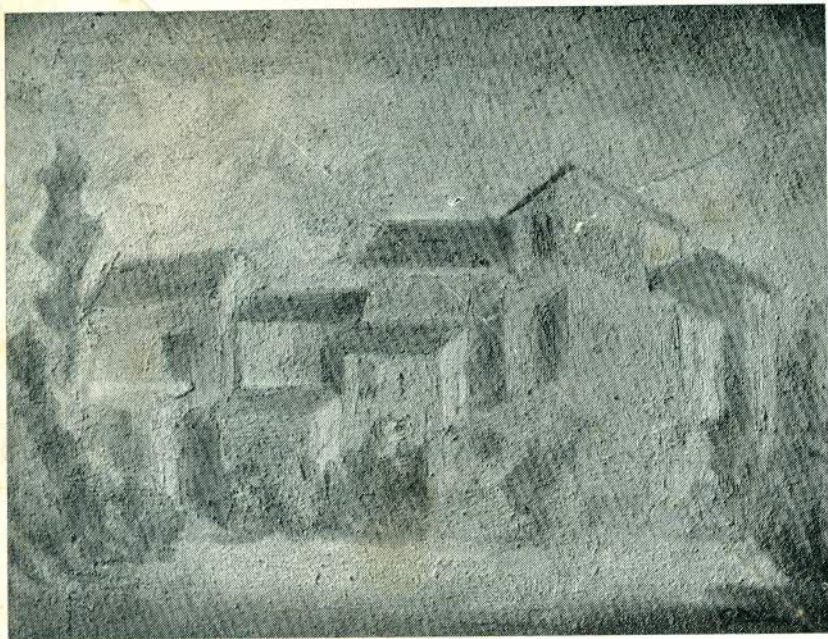
De Tora Gianni - Contrada a S. Agata